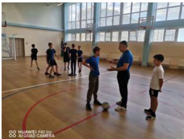
Спортивные соревнования по футболу