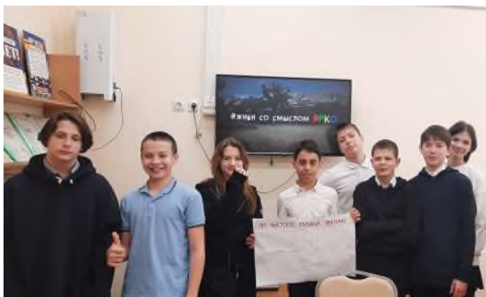
Круглый стол «Твои безопасные каникулы»