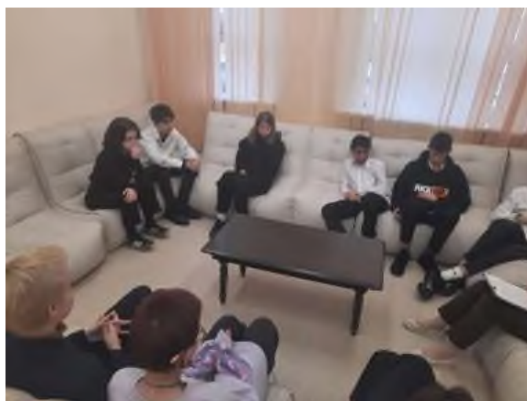
Беседа с элементами тренинга «Жить здорово»