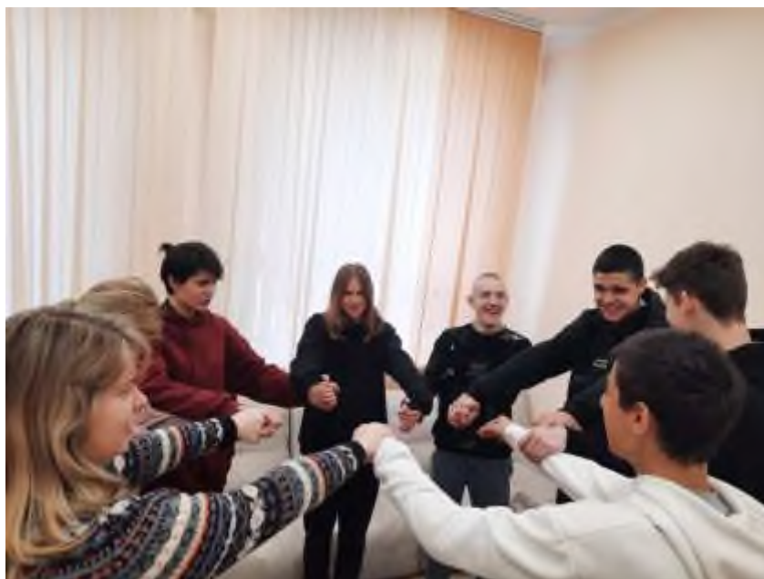
«Профилактика буллинга в школе»