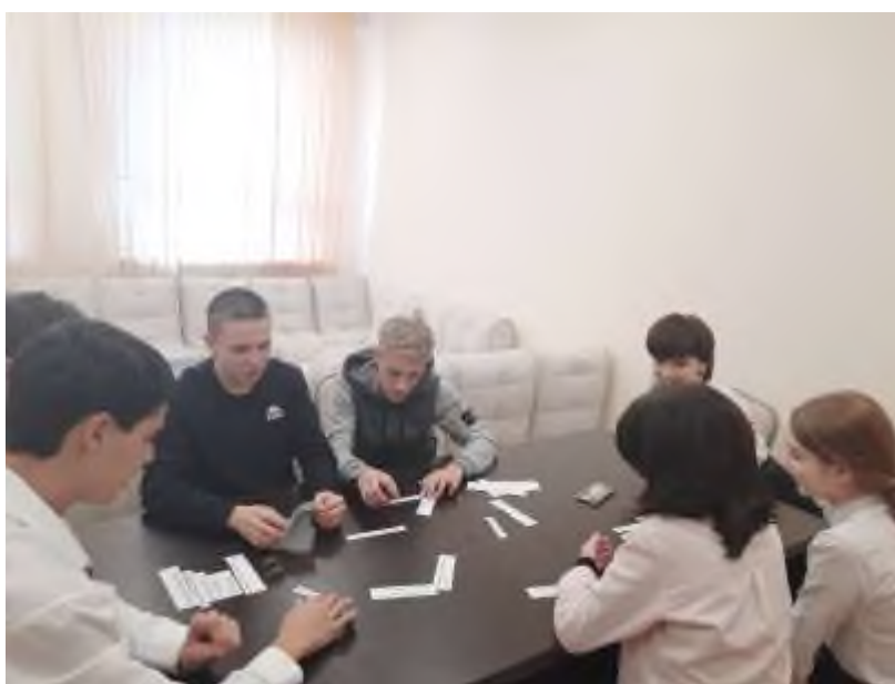
Круглый стол «Вредные привычки»